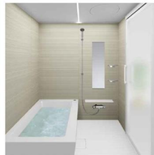
※上記写真はOrioによるイメージ画像です。取付器具・機器の形状及び色調などは実際の仕様と異なる場合がございます。ショールームなどで実物をご確認いただくことをお勧めいたします。